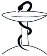
Bund Deutscher Heilpraktiker e.V.

(Mit Entgegennahme des Zertifikates erklärt sich der Teilnehmer damit einverstanden, dass seine Daten an die Dokumentationsstelle Fortbildungszertifikat beim Bund Deutscher Heilpraktiker weiter geleitet werden. Dies geschieht ausschließlich für interne, organisatorische Zwecke. Die Daten werden nicht an Dritte weiter gegeben.)