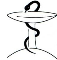
Bund Deutscher Heilpraktiker e.V

Obige Veranstaltung wird im Rahmen des BDH-Fortbildungszertifikates mit 5 Punkten (inkl. evtl. Evaluation) bewertet.