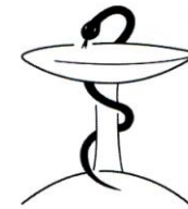
Bund Deutscher Heilpraktiker e.V.

(Mit Entgegennahme des Zertifikates erklärt sich der Teilnehmer damit einverstanden, dass seine Daten an die Dokumentationsstelle Fortbildungszertifikat beim Bund Deutscher Heilpraktiker weiter geleitet werden. Dies geschieht ausschließlich für interne, organisatorische Zwecke. Die Daten werden nicht an Dritte weiter gegeben.)