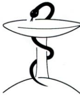
Bund Deutscher Heilpraktiker e.V

Obige Veranstaltung wird im Rahmen des BDH-Fortbildungszertifikates mit 5 Punkten (inkl. evtl. Evaluation) bewertet.